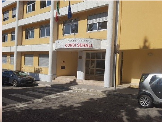
I.I.S. "Einstein - De Lorenzo" - Potenza Sede via Sicilia

"I.I.S. Einstein - De Lorenzo" Potenza Aula Magna - via Sicilia