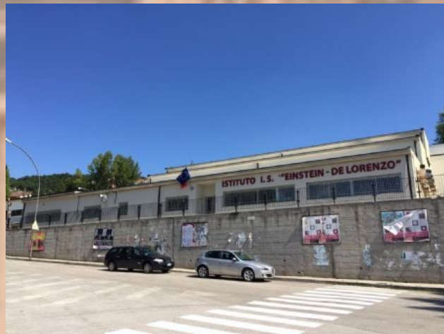
I.I.S. "Einstein - De Lorenzo" - Potenza Sede via Danzi