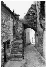
I PERCORSI DEL GUSTO ITINERARIO ENO-GASTRONOMICO